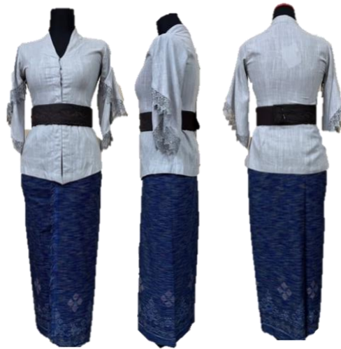
Gambar 1 Koleksi Busana Bèrbudi Bawa Leksana – Ready to Wear I

Eksperimen dalam penentuan bahan, pemilihan teknik perwujudan karya, serta penentuan desain yang nyaman, menarik, unik dan akhirnya bermuara pada branding , namun tetap mengacu pada aturan yang diberlakukan untuk busana adat Bali sesuai Pergub Nomor 79 Tahun 2018. Berikut merupakan 6 karya busana koleksi Bèrbudi Bawa Leksana.