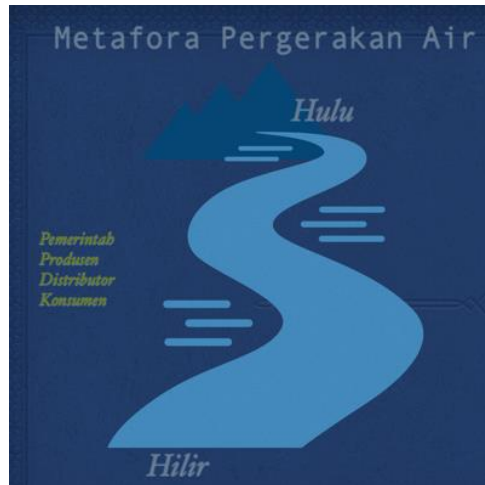
Gambar 7 Ilustrasi Metafora Pergerakan Air

Bali yang diperankan oleh masyarakat Bali juga digunakan dan dinikmati oleh masyarakat Bali itu sendiri.