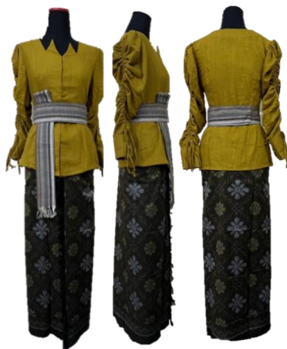
Gambar 4 Koleksi Busana Bèrbudi Bawa Leksana – Ready to Wear Deluxe II