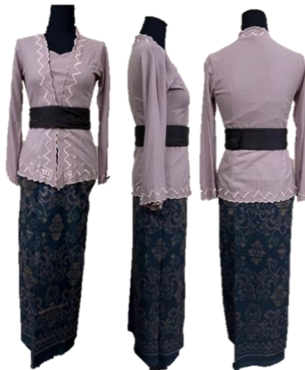
Gambar 2 Koleksi Busana Bèrbudi Bawa Leksana – Ready to Wear II