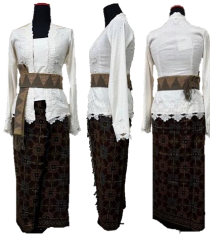
Gambar 3 Koleksi Busana Bèrbudi Bawa Leksana – Ready to Wear Deluxe I

Terdapat dua busana ready to wear dalam koleksi busana Bèrbudi Bawa Leksana, desain ready to wear ini dibuat menggunakan tekstil endek sebagai tekstil utama yang dimanfaatkan sebagai kamen , sedangkan tekstil jenis linen digunakan sebagai bahan utama dalam pembuatan kebaya. Dalam perwujudan desain tidak terlepas dari eksplorasi sehingga penambahan detail dilakukan pada proses perwujudan karya dengan teknik bordir dan payet. Dasar pemilihan medium tekstil tersebut sesuai dengan jenis busana ready to wear yang bersifat siap pakai, dapat diproduksi secara masal, tentu dengan ongkos produksi yang lebih rendah jika dibandingkan dengan karya ready to wear deluxe dan haute couture . Busana ready to wear ini ditujukan untuk pekerja dengan mobilitas tinggi, sehingga desain yang dibuat lebih sederhana dan dapat digunakan tanpa longtorso untuk memberi kenyamanan dan keleluasaan saat bekerja.