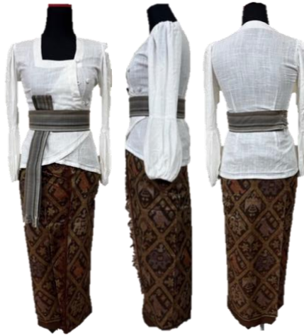
Gambar 5 Koleksi Busana Bèrbudi Bawa Leksana – Ready to Wear Deluxe III

Berbeda dengan desain karya ready to wear , karya ready to wear deluxe memiliki desain dengan potongan dan pola yang lebih rumit, selain itu bahan yang digunakan memiliki kualitas yang lebih tinggi, yaitu tekstil endek dengan benang sutra, rang-rang dengan teknik pewarnaan alami, dan sedikit tekstil jenis linen. Desain seperti pada gambar 3,4, dan 5 ditujukan untuk pekerja kantor yang memiliki akses pekerjaan di dalam ruangan dengan mayoritas pekerjaan dilakukan dalam posisi duduk, sehingga busana yang digunakan sesuai dengan kondisi pekerjaan pengguna.