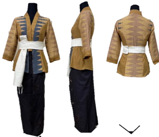
Gambar 6 Koleksi Busana Bèrbudi Bawa Leksana – Haute Couture

Berbeda dengan desain karya ready to wear , karya ready to wear deluxe memiliki desain dengan potongan dan pola yang lebih rumit, selain itu bahan yang digunakan memiliki kualitas yang lebih tinggi, yaitu tekstil endek dengan benang sutra, rang-rang dengan teknik pewarnaan alami, dan sedikit tekstil jenis linen. Desain seperti pada gambar 3,4, dan 5 ditujukan untuk pekerja kantor yang memiliki akses pekerjaan di dalam ruangan dengan mayoritas pekerjaan dilakukan dalam posisi duduk, sehingga busana yang digunakan sesuai dengan kondisi pekerjaan pengguna.