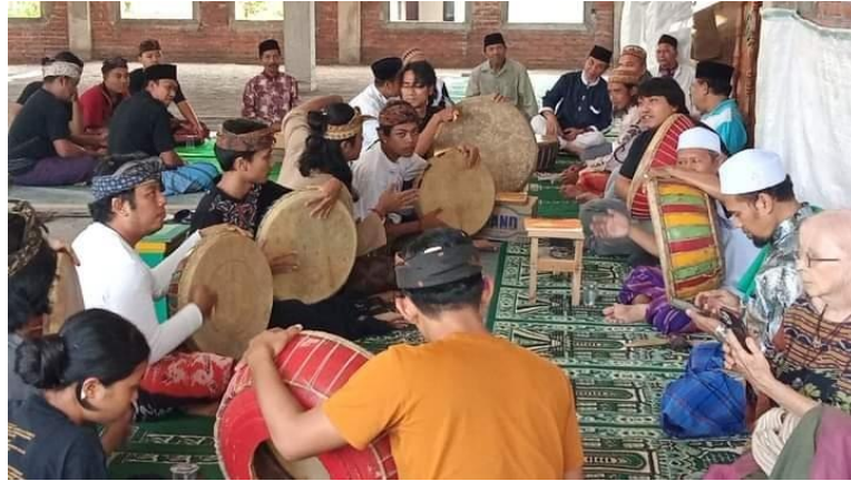
Gambar 7. Mapaguruan Burdah di Desa Saren Jawa, Desa Budakeling, Karangasem.

Mapaguruan Rudat secara langsung tidak dapat dilaksanakan mengingat kendala waktu. Oleh karena itu, kami belajar ragam gerak Rudat melalui akun youtube https://www.youtube.com/watch?v=KZuHBeQPI2w yang berjudul Rudat Milenia Kampung Islam Saren Jawa Budakeling. Untuk kebutuhan penelitian dan penciptaan seni (P2S) ini, refrensi dari youtube kiranya cukup dan semoga ada kesempatan lain agar mahasiswa atau penari mendapat pengalaman belajar langsung dari pemilik kebudayaannya.