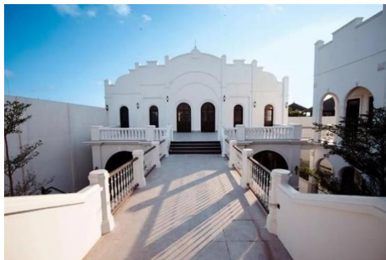
Gambar 9. Lokasi ngebah di Pitaloka Sanur, Denpasar

Ngebah atau peluncuran karya rencananya dilaksanakan di panggung arena di jabaan Pura Padma Ardanareswara kampus ISI Denpasar pada minggu ketiga bulan September 2022. Kesempatan rupanya datang lebih awal. Penata mendapat tawaran bekerjasama untuk mengadakan pementasan serangkaian perayaan kemerdekaan RI oleh manajemen Pitaloka Sanur. Momentum yang terhubung dengan tema dan pesan yang ingin disampaikan dalam Tari Panji Masutasoma, sehingga ngebah akan dilaksanakan bertepatan dengan perayaan 77 Indonesia Merdeka pada tanggal 17 Agustus 2022. Selepas ngebah , harapan penata karya ini dapat bertumbuh, menyempurnakan dirinya seiring kesempatan-kesempatan yang hadir untuk mepresentasikannya kembali.