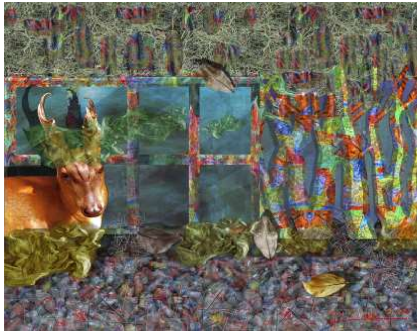
Gambar 2. Karya II “Bayang-Bayang Penderitaan Di Masa Depan”, 100 x 120 cm, kanvas, 2022

Jadi pesan yang disampaikan dalam karya ini adalah mengajak untuk berduka pada lingkungan dengan cara memilih menggunakan bahan-bahan organik contohnya seperti minum dari buah kelapa, makan makanan dengan kemasan bahan ramah lingkungan maka tujuan mencapai lingkungan yang sehat dapat terwujud.