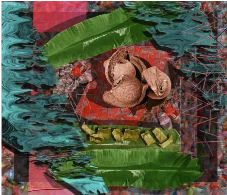
Gambar 1. Karya I, "Back to Traditional Packaging" 2022, Media Kanvas, 100 x 80 cm

Ide pada karya berjudul "Back to Traditional Packaging" ini, adalah mengungkapkan tentang dominasi budaya penggunaan bahan anorganik yang menghasilkan sampah-sampah yang tidak mudah terurai. Untuk memvisualisasi tentang ide tersebut digunakan beberapa tanda yang dapat mewakili setiap maksud yang ingin disampaikan melalui karya fotografi ekspresi ini. Pada karya ini ditampilkan citra visual yang kontradiktif yaitu citra visual yang berasal dari objek material sampah anorganik dengan organik. Citra sampah organik seperti buah kelapa, daun pisang memiliki karakteristik yang berbeda lebih ramah lingkungan dari pada sampah anorganik seperti kaleng, botol plastik, kantong plastik, tipet plastik. Sampah anorganik merupakan produk industri yang memiliki sifat sangat sulit diurai. Penggunaan material yang berbeda ini memiliki pesan simbolik yang menyampaikan situasi saat ini menghadapi krisis dan ancaman dari semakin banyak atau dominannya penggunaan material anorganik yang tidak diikuti oleh kesadaran dalam hal penggunaannya. Pencipta berharap masyarakat bisa sadar akan lingkungan dengan cara kembali menggunakan bahan organik.