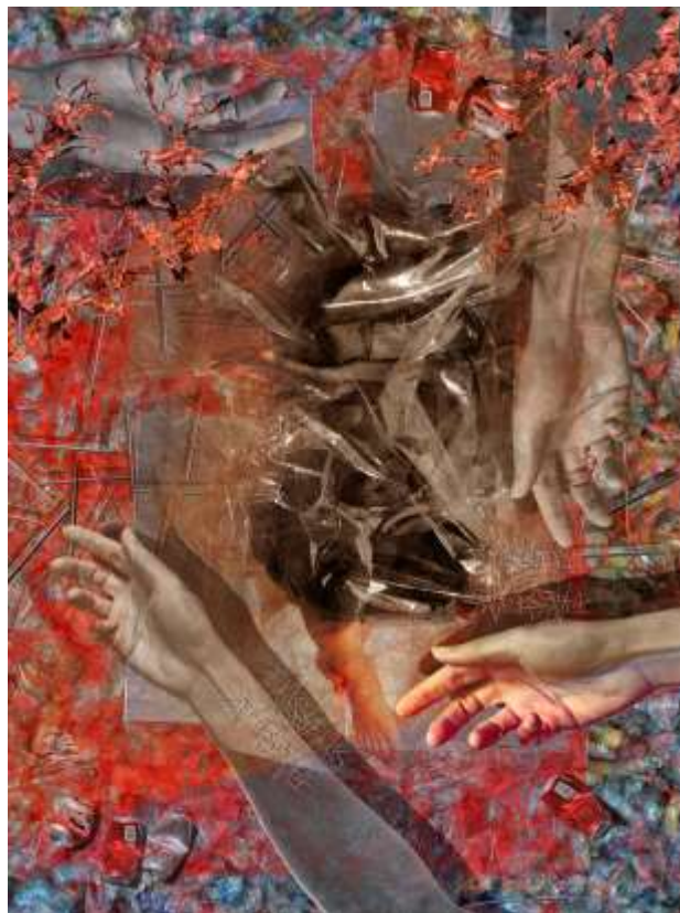
Gambar 3. Karya III, "Situasi Yang Tidak Diharapkan"

Melalui karya ini pencipta ingin menyampaikan pesan bahwa setiap bagian dari sampah plastik yang di buang atau ditanam dalam tanah akan berdampak buruk pada lingkungan baik bagi pepohonan maupun ekosistem lain dan kandungan elemen dalam tanah. Sehingga kedepannya diharapkan masyarakat lebih bisa menghargai dan peka terhadap lingkungan khususnya tanah agar tetap bersih dari sampah plastik karena tanah menjadi bagian penting dalam menjaga keseimbangan ekosistem.