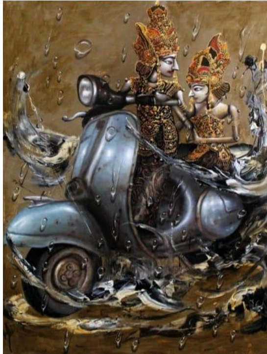
Gambar 3. Endro Banyu, Rama dan Shinta, 130 cm x 100 cm, Cat akrilik pada kanvas, 2020 [10]

Dalam seminar nasional pada PKB ke XLIV di Denpasar Bali, I.G.N. Nurata, mendeskripsikan bahwa : Karya seni lukis berjudul Rama dan Shinta ini terinspirasi dari episode cerita pewayangan Ramayana yakni tentang perjalanan Rama dan Shinta dalam memelihara rasa cinta kasih sejati dan kesetiaan. Karya ini bercitra realistik, naratif, imajinatif dan filosofis yang digarap dengan teknik sapuan dan dusel dengan penekanan gelap-terang pada unsur visual bentuk. Gaya bahasa/stilistika rupa personal olah cipta unsur visual elemen air pada karya seni lukis ini tervisualisasikan pada sentuhan akhir bentuk tetesan butir-butir air jernih pada permukaan bidang dua dimensional. Karya seni lukis bertema perjalanan Rama dan Shinta masa kini dalam memelihara rasa cinta kasih sejati dan kesetiaan dalam hidupnya, sebagai visualisasi pesan moral pada generasi lintas zaman pada masa kini memelihara rasa cinta kasih dan kesetiaan demi terciptanya kedamaian, meneladani laku urip (sikap hidup) Rama dan Shinta dalam memelihara rasa cinta kasih sejati dan kesetiaan demi terciptanya kedamaian hidup yang dilandasi oleh kejernihan hati dan pikiran. [11]