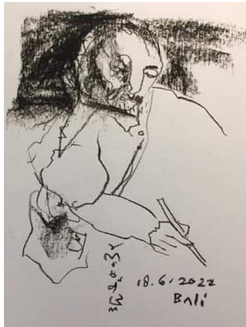
Gambar 1. Pelukis : Made Budiana. Judul : Nyeket saja kok repot, repot saja kok nyeket. Bahan : tinta cina, Ukuran : 45 cm x 60 cm, Tahun 18-Juni-2022. [6]

ketersediannya biasanya terbatas. Namun Multikulturalisme menyediakan berbagai ragam budaya yang berkebinekaan, berbeda-beda tetapi tetap satu budaya Nusantara.