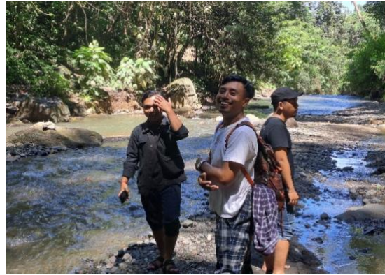
Gambar 1 dan 2. Eksplorasi Penjajagan ke Objek Air Terjun