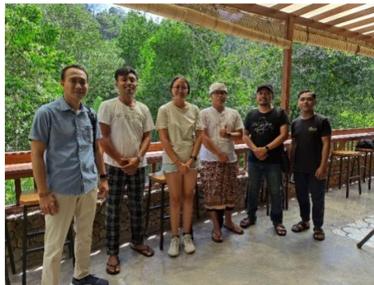
Gambar 5. Bertemu Pengelola Objek Air Terjun Plaga Eko Park