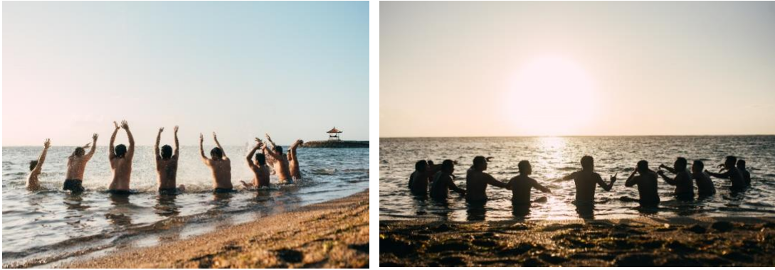
Gambar 8 dan 9. Proses Karya Cak “ GanggaRam ” di Pantai Sanur