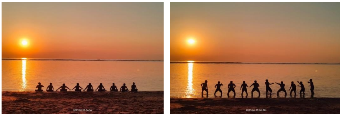
Gambar 10 dan 11. Improvisasi Gerak Cak “ GanggaRam ” di Pantai Sanur

Proses pencarian dan pengolahan unsur musikal dari air dilakukan di laut. Riak air dengan penuangan teknik dari pukulan Nyading pada gamelan Gambang, ditransformasikan pada ritme air. Selain itu, bentuk ritmis berbagai bentuk pola pukulan lainnya di air juga dibuat sebagai penguat karakteristik cak air pada pertunjukan ini.