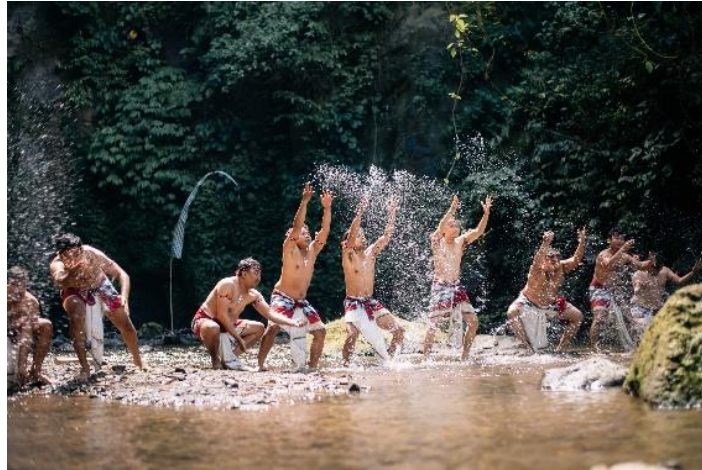
Gambar 16. Penyajian Karya Cak “GanggaRam” di Air Terjun Goa Gong, Plaga Eko Park

Tata penyajian karya Cak “GanggaRam” dibagi menjadi tiga bagian. Pertama, pola vocal pung masing-masing pemain secara bersautan keluar dari sisi tebing kanan dan kiri menuju titik 1 di depan air terjun. Setelah semua pemain berkumpul, vocal cak dilanjutkan dengan permainan bodycak dan semua pemain berbalik ke hadapan air terjun untuk melantungkan vocal yang diambil dari aksara suci Ang, Ung, Mang dan symbol aksara Pangider Bhuana (Sa, Ba, Ta, A, I, Na, Ma, Si, Wa, Ya) dan vocal pemujaan Dewi Gangga sebagai lambang pemulyaan air (kesuburan). Bagian kedua, semua pemain kecak berbalik kembali ke hadapan penonton. Pola garap vocal cak dipadukan dengan pola ritmis dari riak air dengan transformasi teknik nyading pada Gambang. Pola musical ini kemudian dilanjutkan dengan pukulan dari bebatuan dan kulkul kayu menuju arah depan air terjun. Bagian ketiga, pertunjukan dilakukan tepat dibawah air terjun dengan melakukan atraksi air terjun dan pola permainan ritmis pukulan kulkul.