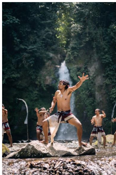
Gambar 15. Penyajian Karya Cak “GanggaRam” di Air Terjun Goa Gong, Plaga Eko Park

Tahap Forming memberikan gambaran kepada semua pendukung karya terkait dengan reka penyajian cak yang diinginkan. Diberikan juga ruang kepada pendukung karya untuk berinovasi secara kreatif merespon materi yang diberikan dengan penuh ekspresif.