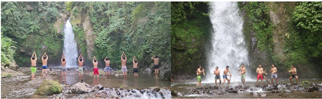
Gambar 13 dan 14. Fose Simbol Pemujaan Dewi Gangga dalam Cak “GanggaRam”

Tahap Forming memberikan gambaran kepada semua pendukung karya terkait dengan reka penyajian cak yang diinginkan. Diberikan juga ruang kepada pendukung karya untuk berinovasi secara kreatif merespon materi yang diberikan dengan penuh ekspresif.