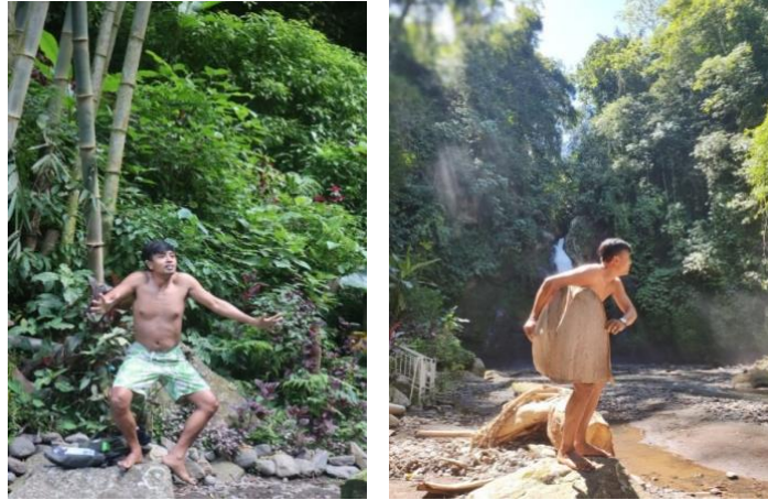
Gambar 12. Bentuk Fose Cak “GanggaRam” di Sisi Air Terjun