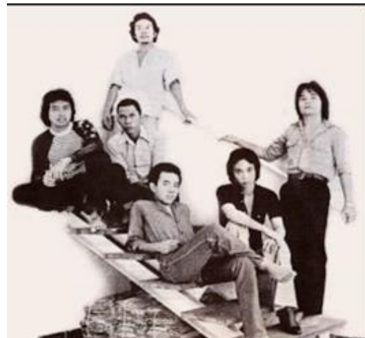
Gambar 1. Sampul Depan Guruh Gypsy (Kiri) dan Enam Personel Guruh Gypsy yang Melahirkan Album Guruh Gypsy (Kanan)

Simbol lain yang lebih tegas diperlihatkan oleh penampakan kaligrafi Dasa Bayu pada sampul depannya. Kongkretnya berupa rangkaian 10 aksara Bali yang memiliki arti dan makna tertentu. Yaitu I-A berarti kejadian dan keadaan, A-Ka-Sa berarti kesendirian dan kekosongan, Ma-Ra berarti baru, La-Wa berarti kebenaran dan Ya-Ung berarti sejati. Sejak zaman dahulu, simbol tersebut dimaknai sebagai suatu keadaan hampa atau kosong yang kelak akan berubah menjadi kebenaran yang hakiki. Diduga dari sinilah inspirasi untuk judul album diperoleh [10].