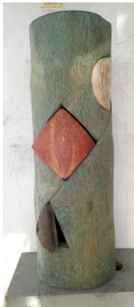
Gambar 7. Tiga Dunia

Keangkuhan, kesombongan, dan rasa egois yang ada pada setiap ciptaan tuhan tak terkecuali para dewapun tunduk takluk dihadapanNya. Narasi ini sesuai dengan awal kisah Bhomantaka. Ketika Dewa Brahma dan Dewa Wisnu bercakap cakap, beliau dikejutkan oleh sebuah lingga permata yang menyebabkan kedua Dewa tersebut berniat untuk mengetahuinya. Benda ajaib tersebut semakin dipandang semakin tinggi dan besar yang menyebabkan Dewa Wisnu maupun Dewa Brahma penasaran, dan menghujani lingga permata tersebut dengan senjatanya masing-masing. Usaha kedua Dewa itu sia-sia belaka, karena lingga permata itu semakin membubung tinggi, sedangkan pangkalnya tidak tampak.