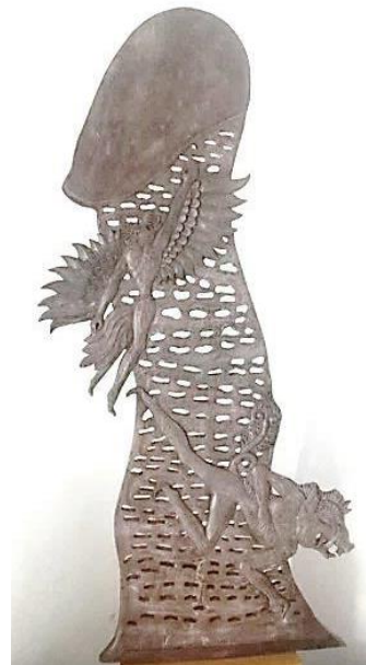
Gambar 8. Dua Dunia [ Sumber : I Made Suparta, 2023 ]

Atas kesepakatan kedua Dewa tersebut Dewa Brahma berubah wujud menjadi burung dan terbang melayang mencari ujung lingga permata, dan Dewa Wisnu ke sapta petala (dasar bumi) mencari pangkalnya dengan berubah wujud menjadi babi. Usaha untuk menemukan ujung maupun pangkal lingga permata oleh kedua Dewa itu tanpa membuahkan suatu hasil. Kejengkelan Dewa Wisnu karena usahanya tidak berhasil diluapkan dengan memporak-porandakan dasar bumi yang membuat terkejut Bhatari Basundari, yang saat itu Wisnu sedang berwujud babi [13].