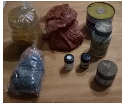
Gambar 6. Jenis-Jenis Warna