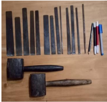
Gambar 5. Jenis Pahat dan Temotok [ Sumber : I Made Suparta, 2023 ]