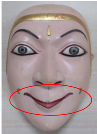
Gambar 1. Topeng Burung Garuda

cat, semir atau pewarna lainnya. Adapun tujuan finishing supaya obyek kelihatan lebih halus, berkerakter dan sebagai pengawet karya [6].