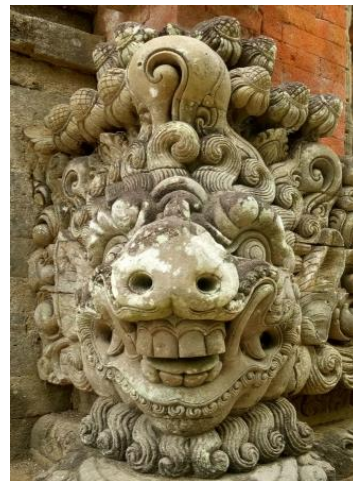
Gambar 4. Karang Babi di Pura Desa Batubulan [ Sumber : I Made Suparta, 2023 ]

Sumber pokok perolehan data yang lengkap dan akurat dalam penciptaan ini diupayakan lewat studi pustaka dan studi lapangan. Data yang bersumber dari penciptaan terkait dengan cerita Legodbhawa. Kelengkapan data untuk penciptaan dilakukan dengan metode pengamatan langsung, wawancara dan dokumentasi. Observasi dan wawancara dilakukan secara langsung dengan para seniman, budayawan, kriyawan dan tokoh-tokoh yang memahami cerita legodbhawa. Terkait dalam penciptaan yang berinspirasi Legodbhawa akan dilakukan dan ditetapkan batasan-batasan secara spesifik, yakni dari tahap pradesain sampai finishing memperhatikan setiap karakter tokoh, alur cerita, teknik, bahan, dan ketepatan penggunaan peralatan pada setiap karya. Langkah ini juga dilakukan untuk mendapatkan alur cerita Legodbhawa pada setiap bagiannya, sedangkan klasifikasi data dipilah-pilah disesuaikan dengan kebutuhan visualisasi karakter pada setiap tokoh.