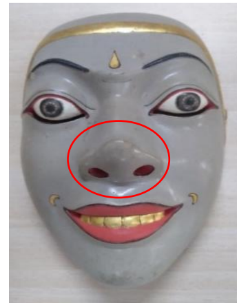
Gambar 2. Topeng Babi