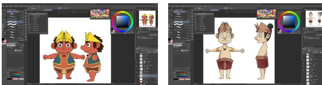
Gambar 3. Bentuk Tubuh Karakter animasi cupak gerantang

Selanjutnya membuat bentuk tubuh karakter. Dalam sketsa bentuk tubuh sebenarnya sudah digambarkan, namun pada tahap ini merupakan penyempurnaan bentuk yang didasari pada konsep bentuk fisik diatas, berapa tinggi dan berat badan dari semua karakter yang akan dibuat. Dalam proses pembuatan bentuk tubuh ini juga bisa menggunakan grid atau garis bantu agar komposisi bentuk badan, kepala, kaki dan tangan seimbang. Garis bantu juga memudahkan dalam menarik garis-garis hotline untuk bentuk karakter yang sempurna. Tahapan ini akan memerlukan waktu yang cukup lama karena merupakan lanjutan dari sket dasar menjadi sebuah karakter yang memiliki bentuk sesuai dengan konsep karakter animasi yang dibuat .