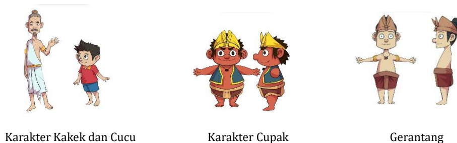
Karakter Kakek dan Cucu

Pembuatan karakter animasi memerlukan skill dalam pembuatan visualnya, gambar karakter harus sesuai dengan isi cerita yang sudah ditentukan, Adapun tokoh karakter dalam animasi cupak gerantang ini adalah: