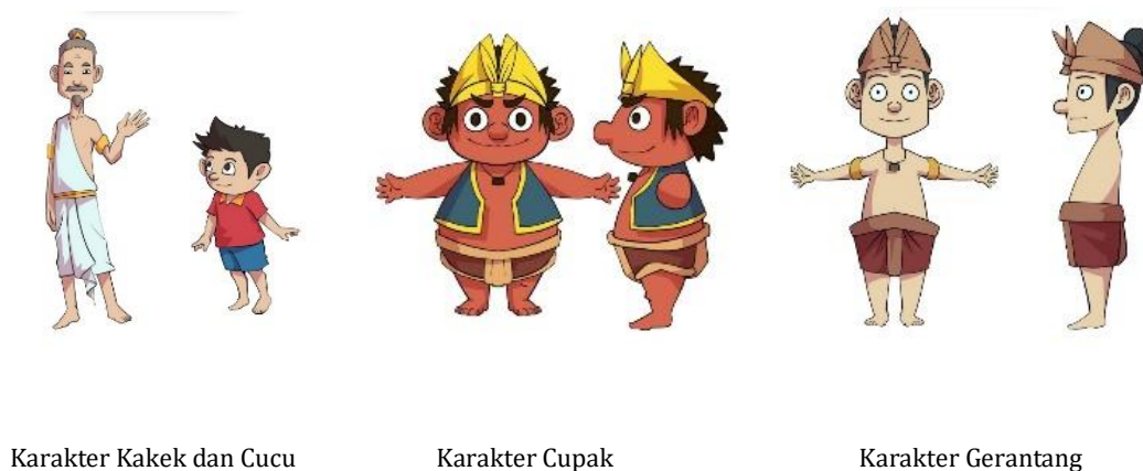
Karakter Kakek dan Cucu

Membuat gaya yang Berbeda dan gaya pakaian/Aksesoris Karakter Animasi Pose atau gaya gerak tubuh karakter, merupakan asset selanjutnya dalam membuat karakter yang akan bisa dilanjutkan menjadi sebuah animasi. Dalam asset ini, illustrator bisa membuat beberapa gaya untuk satu karakter dalam sebuah cerita. Contoh misalnya karakter saat berdiri, tampak depan, blakang dan samping, saat berjalan, saat berdiri, berlari dan lain sebagainya. Selanjutnya dalam tahap ini, sudah pasti merujuk pada tahap finishing dimana karakter sudah memiliki pakaian, apakah pakaian lengan panjang, pendek, rompi dan sebagainya. Aksesoris yang berupa kalung, gelang, senjata dan atribut lainnya. Adapun karakter yang diciptakan dari proses diatas adalah sebagai berikut[7] :