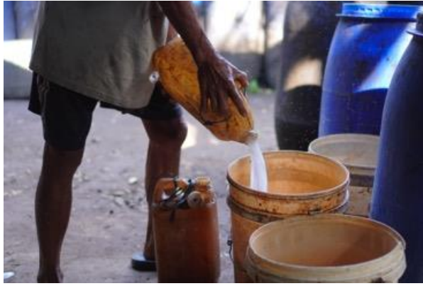
Gambar 3. Penyadap Tuak

Dampak dari maraknya arak gula ini adalah kesulitan bagi produsen arak tradisional yang tetap menggunakan bahan alami dari ketiga pohon tersebut untuk bersaing secara ekonomi. Mereka merasa terdesak dan mengalami penurunan ekonomi karena harga yang lebih murah dari arak gula. Permasalahan ini menjadi serius dan memerlukan pemikiran dan perhatian lebih lanjut untuk melindungi dan mempertahankan tradisi arak tradisional berbahan dasar alami dari ketiga pohon ini.