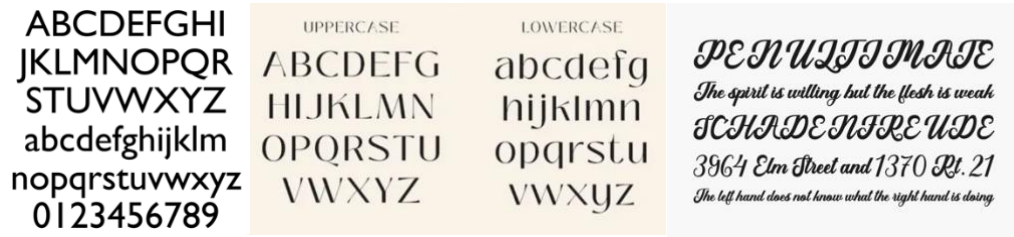
Gambar 8. Huruf yang Digunakan pada Buku Visual Arak Bali