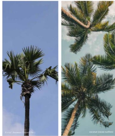
Gambar 5. Pohon Ental dan Pohon Kelapa