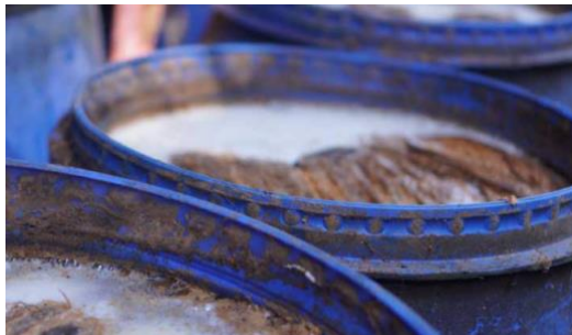
Gambar 6. Proses Fermentasi