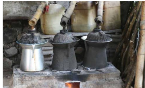
Gambar 7. Proses Distilasi