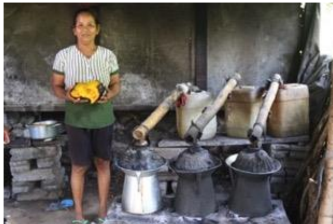
Gambar 1. Produsen Arak Tradisional Banjar Adat Merita [Sumber: Tim Peneliti, 2023]

Dengan demikian, arak telah menjadi elemen penting dalam identitas dan warisan budaya masyarakat di dua wilayah tersebut. Keterlibatan aktif dalam proses produksi arak, baik secara ritual di Pura Arak Api maupun dalam skala kecil di Banjar Adat Merita, mencerminkan hubungan yang dalam antara masyarakat dan warisan budaya mereka, serta menegaskan peran arak dalam mempertahankan identitas budaya yang kuat di tengah arus perubahan sosial dan ekonomi.