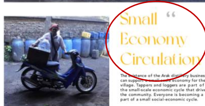
Gambar 10. Aplikasi Warna Jingga pada Headline