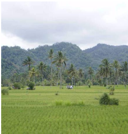
Gambar 4. Lanskap Daerah Sidemen

Kategori fotografi yang dominan digunakan dalam buku ini adalah foto documentary, untuk mengabadikan setiap tahap produksi arak dari awal hingga distribusi. Sementara itu, beberapa elemen fotografi diambil dalam bentuk lanskap untuk memperlihatkan kondisi daerah seperti yang ditampilkan pada gambar 4 dan 5, dan fotografi still life digunakan untuk memvisualisasikan alat dan bahan pokok yang digunakan dalam proses tradisional pembuatan arak yang ditampilkan pada gambar 6 dan 7.