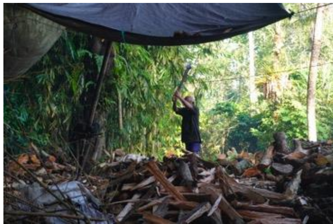
Gambar 2. Pemasok Kayu Bakar

peran penting dalam rantai produksi arak tradisional di Desa Sidemen dan merupakan bagian integral dari warisan budaya yang dijaga dengan cermat dan diwariskan dari satu generasi ke generasi berikutnya.