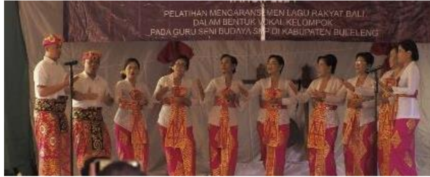
Gambar 3 Para Guru menampilkan lagu Merah Putih dalam bentuk vokal kelompok