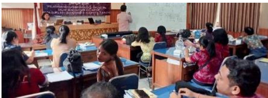
Gambar 2 Penyampaian pengetahuan, dan praktik mengarransemen lagu Merah Putih dalam bentuk vokal kelompok.