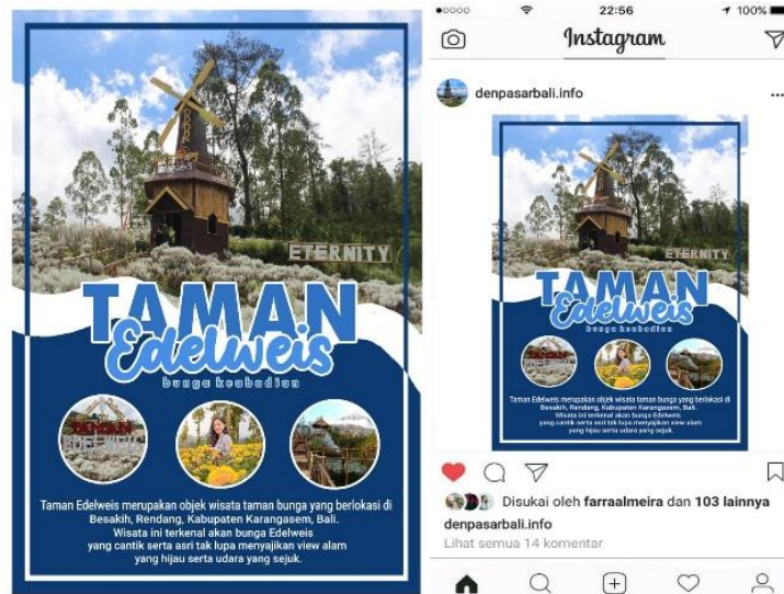
Gambar 3. Hasil Jadi Poster Serta Model Feed Pada Instagram

Berikut adalah contoh hasil jadi poster serta template Instagram yang penulis buat: