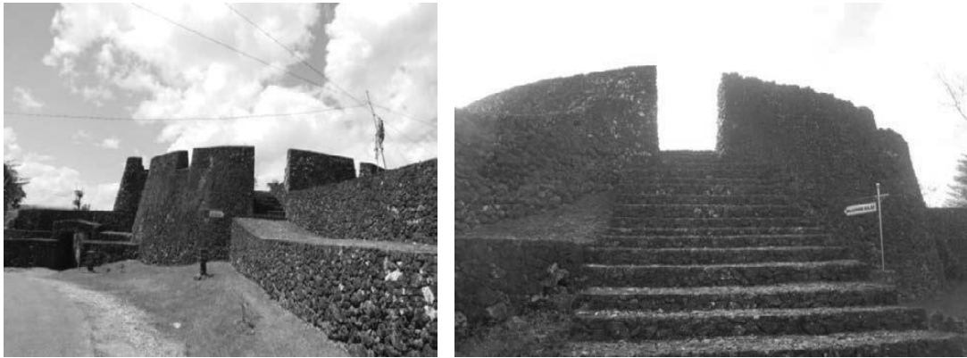
Gambar 1. Benteng Keraton Buton

adalah kawasan Benteng Keraton Buton yang berada di bukit. Seiring berkembangnya perdagangan dan pusat aktivitas ekonomi, maka perluasan kota terjadi ke arah pantai dan kawasan inilah yang dikatakan Baubau yang artinya kota baru. Kini Baubau menjadi salah satu dari sepuluh kota pusaka yang ada di Indonesia untuk dipersiapkan menjadi World Heritage City oleh Kementerian Pekerjaan Umum melalui Program Penataan dan Pelestarian Kota Pusaka (Syahadat, 2014).