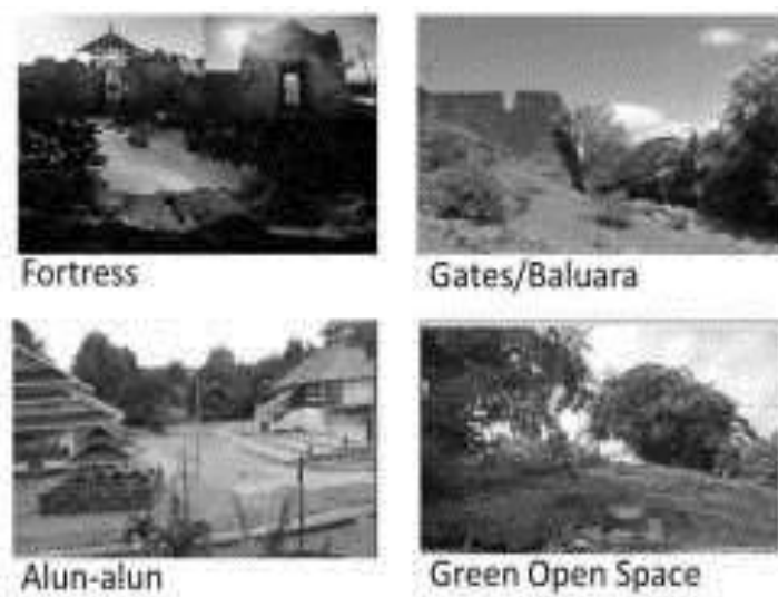
Gambar 2. Elemen-elemen Ruang di Benteng Keraton Buton(1)

Benteng adalah salah satu dari sekian banyak warisan budaya Kesultanan Buton yang memiliki nilai kearifan lokal dan menunjukkan jati diri atau identitas daerah. Benteng Keraton Buton telah menjadi ciri khas Kota Baubau sekaligus ikon kebanggaan masyarakat Buton dan Sulawesi Tenggara. Benteng Keraton Buton terbagi ke dalam beberapa elemen-elemen ruang yang memiliki fungsi yang berbeda, seperti gerbang, pemakaman, istana, masjid, dan lain-lain. Pada masa Kesultanan Buton, Benteng Keraton Buton menjadi ibukota kerajaan, Setelah Indonesia merdeka, maka fungsi kekuasaannya pun hilang, namun demikian fungsi sebagai permukiman tradisional dan tradisi yang berlangsung di era kesultanan masih terus bertahan. Ada begitu banyak objek di Kawasan Benteng Keraton Buton yang mewakili sejarah Buton, oleh karena itu Benteng Keraton Buton saat ini menjadi representasi sejarah dan peradaban kesultanan Buton. Oleh karena itu, perlu dilakukan pelestarian Benteng Keraton Buton yang sejak dahulu hingga saat ini berfungsi sebagai ruang publik yang mewadahi berbagai aktivitas budaya dan kehidupan bermasyarakat di Kota Baubau.