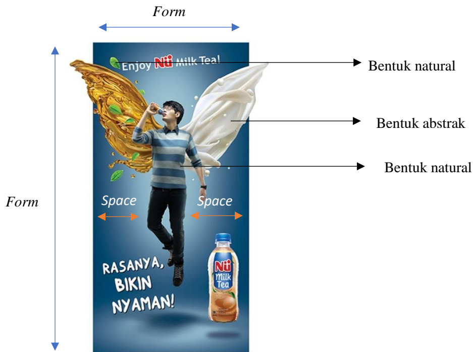
Gambar 2. Form and Space

Form atau bentuk pada billboard Nu Green Tea yaitu berbentuk persegi panjang dengan didukung bentuk-bentuk lain pada billboard tersebut. Diantaranya terdapat bentuk natural dan bentuk abstrak. Bentuk natural terlihat dengan adanya daun teh dan manusia pada billboard. Bentuk abstrak terlihat dengan adanya gabungan antara teh dan susu yang menyerupai bentuk sayap dibelakang ilustrasi manusia tersebut. Space pada billboard terlihat dengan adanya ruang kosong diantara ilustrasi manusia. Billboard ini memiliki sifat semu dengan bentuk dua dimensi.