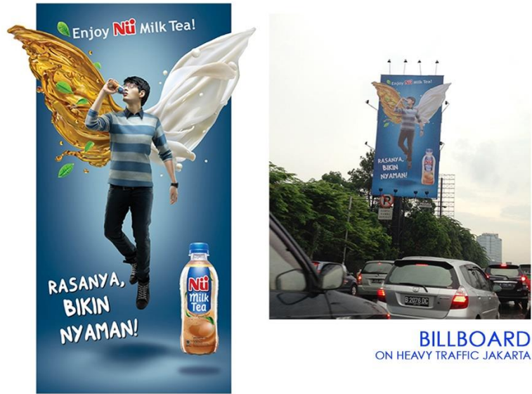
Gambar 1. Billboard Nu Green Tea