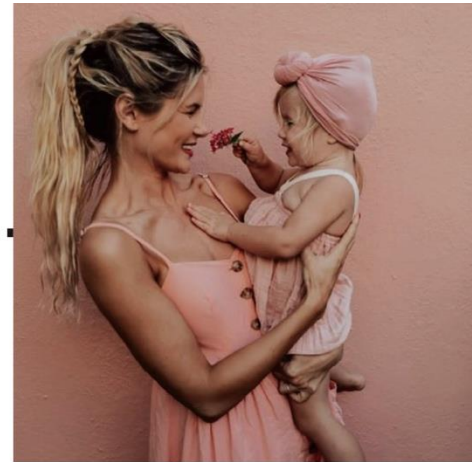
(b) Setting melalui pose, arah objek saling berhadapan antara ibu dan anak, aksesoris (warna), busana, ekspresi.