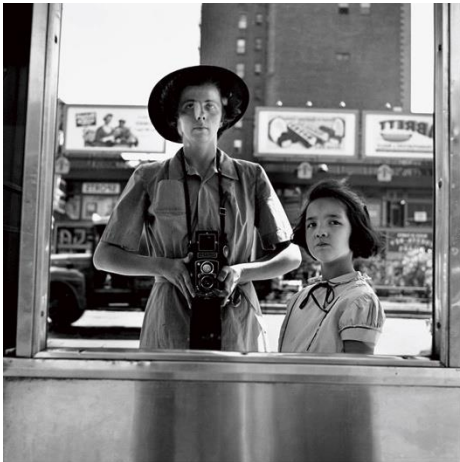
(a) Permainan dimensi visual berupa bingkai kaca sebagai frame internal.

Apabila merujuk pada kategori foto represent semacam ini di Instagram, akan berbeda. Misalkan pada pose seorang ibu dengan anak bergaya tertentu dengan settingan (pengaturan/intervensi dalam menentukan) sedemikian rupa sehingga foto tampak seolah natural, (Barton, 2018). Berbeda dengan pendekatan Vivian Maier, ia mencoba menekankan permainan dimensi visual berupa elemen geometris seperti pantulan etalase kaca, lapisan latar dan bingkai internal foto. Melalui dua foto subjektivikasi represent di bawah ini, perbedaan permainan aspek fotografi terlihat signifikan sebagai berikut.