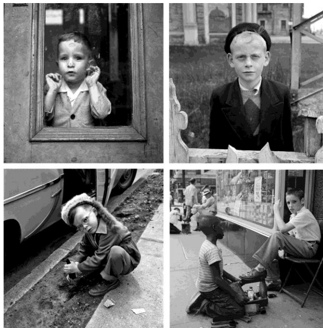
Gambar 5. Foto anak yang terdeteksi adanya “kontak mata” dengan fotografer

Kategori subjektivikasi “ with photographer ” diartikan sebagai foto anak dengan tampilan ekspresif seolah-olah berkomunikasi dengan fotografer (yang berada di balik kamera) secara tersirat. Menurut Zappavigna, pada kategori with photographer , gambar tidak terdapat sosok fotografer atau tanda berupa bagian tangan maupun bayangan. Namun biasanya ada sedikit petunjuk yang muncul pada gambar seperti gelas berisi minum si fotografer yang berhubungan dengan aktivitas anak ketika meminum gelas lainnya. Namun apabila mencermati karya-karya Vivian Maier hubungan fotografer dengan objek (anak), kehadiran fotografer tersirat melalui pandangan mata anak.