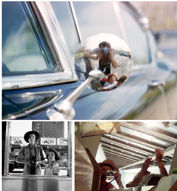
Gambar 1. (atas) Berfoto di pantulan bagian belakang kaca spion, (kiri bawah) foto di pantulan cermin pinggir jalan, dan (kanan bawah) berfoto pada kaca.

Pada penelitian ini, fotografi anak karya Vivian kategori as photographer-“represent” ditemui sebanyak tiga foto, satu foto hitam-putih dengan format square dan dua foto dengan format landscape berwarna. Namun pada kategori lainnya, fotografi dengan kategori represent semacam foto diri ( selfie ) ditemui cukup banyak, hingga John Maloof mengategorikan foto-foto dengan tipe seperti itu masuk dalam kelompok foto selfie . John Maloof sengaja memasukkan kategori ini menjadi satu album Vivian Maier secara terpisah dalam website vivianmaier.com . Foto-foto tersebut menampilkan Vivian Maier sendirian atau berada dengan objek lainnya selain anak. Berikut adalah tiga foto yang ditemui dengan kategori represent .