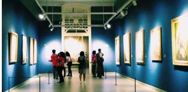
Gambar 2 : Interior dengan tema lukisan keseharian.

kualitias harmoni yang berasosiasi dengan laut dan langit. Nuansa biru sebagai simbol air (sumber kehidupan) juga dapat memberikan efek suasana tenang. Sentuhan pencahayaan putih menimbulkan suasana menenangkan dan memberikan kedamaian.