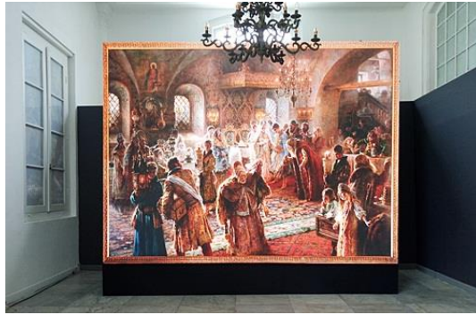
Gambar 10 : Konsep tata ruang lobi entrance.

Indeks, lukisan Konstantin Egorovick Makovsky berjudul Perkawinan Adat Rusia ( Pribite Nevesti ). Makovsky mengusung hampir semua keterampilan visualnya dengan gaya Romantisisme pada Perkawinan Adat Rusia dan gaya Neo-Klasikisme pada Upacara Dewa Bakhis.