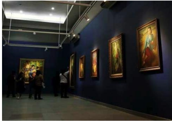
Gambar 8 : Konsep tata ruang dengan tema lukisan tradisi.

Indeks, lukisan “Pronocitro” karya Gambiranom merupakan pesan moral dari kisah percintaan di Jawa Tengah. Hingga kini kisah ini masih dikenang sebagai kisah cinta yang abadi di masyarakat Jawa. Adapun pesan moral yang dapat dipetik dari kisah Pronocitro dan Rara Mendut adalah bahwa harta, pangkat, dan jabatan bukanlah jaminan untuk mendapatkan cinta sejati seseorang.