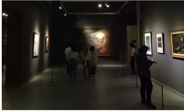
Gambar 4 : Tata ruang interior dengan tema lukisan spiritual.

Indeks, lukisan “Nyai Roro Kidul” karya Basoeki Abdullah menampilkan nilai-nilai kepercayaan yang menjadi kekuatan bangsa Indonesia. Karya Basoeki Abdullah menjadi salah satu karya fenomenal dalam kategori ini. Lukisan ini memiliki kisah unik dan misteri dibalik pembuatannya. Kabarnya, setiap wanita yang dijadikan model pada lukisan ini, tidak memiliki usia yang panjang.