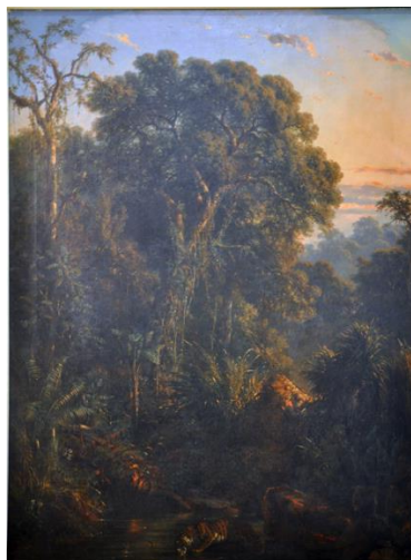
Gambar 7: “Harimau Minum” karya Raden Saleh .

Indeks, “Harimau Minum” karya Raden Saleh menjadi salah satu karya untuk mewakili dalam kategori ini. Lukisan ini adalah salah satu dari enam lukisan yang dimiliki oleh Raden Saleh yang dimiliki istana negara. Unsur romantisme tergambar jelas dengan panorama hutan dengan seekor harimau yang menegak air jernih yang mengalir ditengah kegelapan hutan.