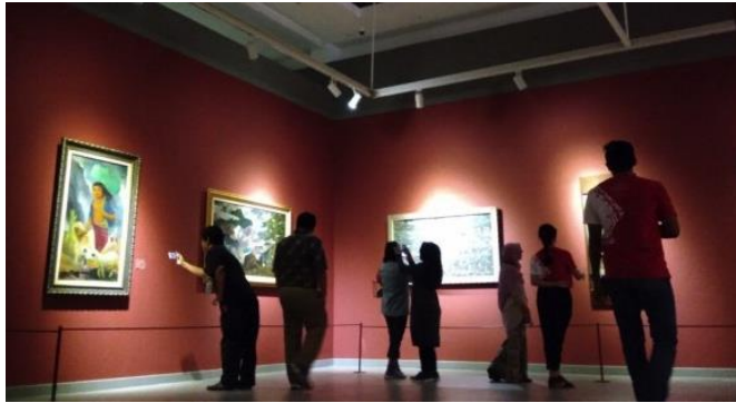
Gambar 6: Tata ruang interior dengan tema lukisan panorama. Foto dokumen Ika Yuni purnama.

Indeks, “Harimau Minum” karya Raden Saleh menjadi salah satu karya untuk mewakili dalam kategori ini. Lukisan ini adalah salah satu dari enam lukisan yang dimiliki oleh Raden Saleh yang dimiliki istana negara. Unsur romantisme tergambar jelas dengan panorama hutan dengan seekor harimau yang menegak air jernih yang mengalir ditengah kegelapan hutan.