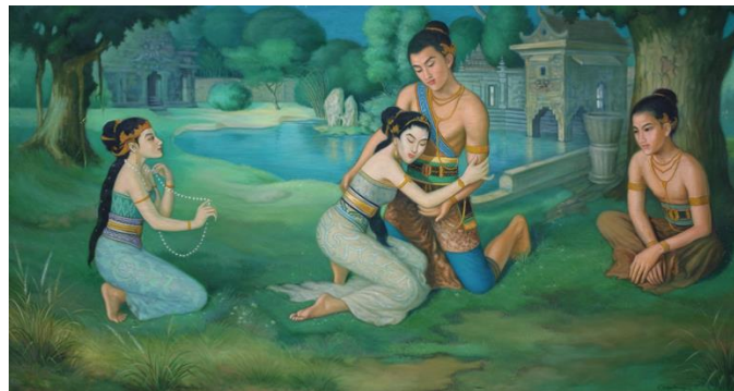
Gambar 9 : “Pronocitro” karya Gambiranom .

Indeks, lukisan “Pronocitro” karya Gambiranom merupakan pesan moral dari kisah percintaan di Jawa Tengah. Hingga kini kisah ini masih dikenang sebagai kisah cinta yang abadi di masyarakat Jawa. Adapun pesan moral yang dapat dipetik dari kisah Pronocitro dan Rara Mendut adalah bahwa harta, pangkat, dan jabatan bukanlah jaminan untuk mendapatkan cinta sejati seseorang.