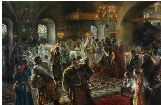
Gambar 11 : Lukisan Konstantin Egorovick Makovsky berjudul Perkawinan Adat Rusia.

Indeks, lukisan Konstantin Egorovick Makovsky berjudul Perkawinan Adat Rusia ( Pribite Nevesti ). Makovsky mengusung hampir semua keterampilan visualnya dengan gaya Romantisisme pada Perkawinan Adat Rusia dan gaya Neo-Klasikisme pada Upacara Dewa Bakhis.