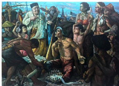
Gambar 3 : “Lelang Ikan” karya Itji Tarmidzi.

Indeks, lukisan karya mengenai dinamika keseharian yang menggambarkan kehidupan sehari-hari kalangan masyarakat Indonesia dari berbagai macam lapisan. Sebanyak 11 lukisan akan mengisi kategori ini di mana “Lelang Ikan” karya Itji Tarmidzi sebagai salah satu karya utama.