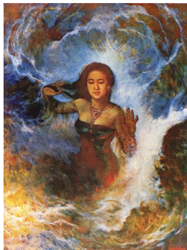
Gambar 5 : “Nyai Roro Kidul” karya Basoeki Abdullah.

Indeks, lukisan “Nyai Roro Kidul” karya Basoeki Abdullah menampilkan nilai-nilai kepercayaan yang menjadi kekuatan bangsa Indonesia. Karya Basoeki Abdullah menjadi salah satu karya fenomenal dalam kategori ini. Lukisan ini memiliki kisah unik dan misteri dibalik pembuatannya. Kabarnya, setiap wanita yang dijadikan model pada lukisan ini, tidak memiliki usia yang panjang.