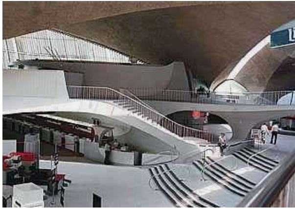
Terminal TWA di Bandar Udara International Kennedy dengan konsep “Gerakan dan Pariwisata”

interior yang indah yang mampu mewujudkan nilai simbolik dan budaya. Seperti yang diungkapkan oleh Santosa (2005) sebagai perwujudan nilai simbolik dan budaya, maka desain dapat dikaitkan dengan faktor nilai, pandangan hidup, kepercayaan, mitos dan lain-lain ke dalam wujud materi yaitu benda kongkrit yang berfungsi untuk mengungkapkan suatu nilai budaya tertentu.